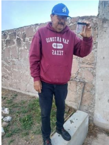
Registro diario de la cloración del agua (registro en bitácora).